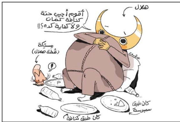
رسم توينز كرتون (مصر) 2025 - 2025 By Twins Cartoon (Egypt)