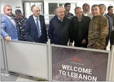
جولة الوزراء في المطار

عليها أن تعمل بكل السبل التي تراها مناسبة بما في ذلك المقاومة، لأجل أن تخرج هذا العدو من هذه الأماكن التي بقي فيها، وهذا تحد كبير لهذه الحكومة التي التزمت ببيناها الوزاري بأنها ستتحذ جميع الإجراءات لأجل تحرير الأرض، مؤكداً "دعم المنطقة لهذه الحكومة من أجل أن تتفقد الالتزامات التي التزموها وتعهدوا بها".