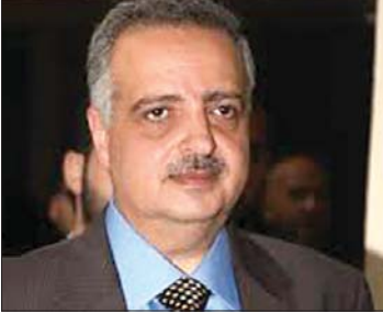
النائب السابق طلال أرسلان

من الشذمة والانقسامات والفتن. عمق الدروز كان ولا يزال وسيبقى عربياً أصيلاً مهما كثرت الأقاويل والاتهامات. وعلى الإدارة السورية الجديدة أن تعي مخاطر المرحلة، وهذا يتطلب وضوحاً وشفافية في مقاربة المشاكل الداخلية السورية، والابتعاد عن الإبهام في الأجوبة والتفسير والمواقف. وبكل صراحة أقول لن تحمي سوريا من الداخل إلا باعتماد الدولة المدنية التي يتساوى فيها كل الشعب السوري في الحقوق والواجبات والعدالة الاجتماعية.»