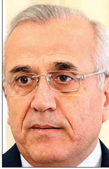
الرئيس مبعش سليمان

تجزئة ولا تقسيم». وتابع: «أقول ذلك لأن لا وظيفة لهذا السلاح طالما الجنوب سيكون خالياً من السلاح والانشاءات العسكرية الا الوظيفة الداخلية المنوطة اساسا بالقوى الامنية اي اعتماد الامن الذاتي واناطة مهام الدفاع عن الوطن لجيش اللبناني. اتوجه بكلامي هذا لجميع المواطنين المتترمين بوثيقة الوفاق الوطني وللمؤيدين للفدرالية والمعارضين لها ولحزب الله وجمهورية، الطائف نص على اللامركزية فلنوسعها. اللهم اني بلغت».