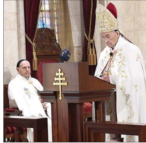
الراعي يلقي عظته

بجميع مفاهيمه. وتجدر الإشارة إلى أن الحيايد لا يعني الإستقالة من «الجامعة العربية»، ومن «منظمة المؤتمر الإسلامي»، ومن «منظمة الأمم المتحدة»، بل يعدل دور لبنان ويفعله في كل هذه المؤسسات وفي سواها، ويجعله شريكاً في إيجاد الحلول عوض أن يبقى ضحية الخلافات والصراعات».