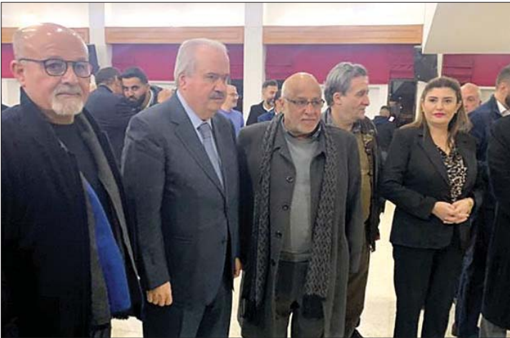
جابر في الاحتفال

الشرق - رأى وزير المالية ياسين جابر «اننا في حكومة الإنقاذ والإصلاح عقدنا العزم أن نعمل بروحية وطنية جامعة بناءً لتعيد إعمار ما هدمته الحرب، مسخرين الإمكانيات والإرادات الطيبة والصدق والإصلاح والشفافية لتأمين مستلزماته ولنيسلم نزيقا وجرحا اصاب اكثر من منطقة ولنقوم بالإصلاحات المطلوبة، فالقوانين جاهزة لها، والعمل على مراسيمها التطبيقية وهيكله قطاعاتها الأساسية، ولا سيما القطاع المصرفي وحفظ حقوق المودعين وتحريرها هم الشاغل والالتزام الذي قطعتة الحكومة على نفسها، وان استقرار الأوضاع السياسية التي تمثلت في انتظام عمل المؤسسات الدستورية بعد شعور تجاوز الستين ونيف، بانتخاب رئيس للجمهورية، وتشكيل حكومة جديدة نالت ثقة نيابية وازنة... كل ذلك إلى ما تضمنه البيان الوزاري من خطط اقتصادية ومالية وتقنية، تؤشر إلى أن مسيرة الاستقرار قد وُضعت على سكة قطار الإقلاع.» الوزير جابر كان يتحدث خلال رعايته حفل اطلاق فاعليات المهرجان الرمضاني للتسوق في مدينة النبطية، والذي اقيم في قاعة مركز كامل يوسف جابر الثقافي في النبطية، بحضور شخصيات وفاعليات.