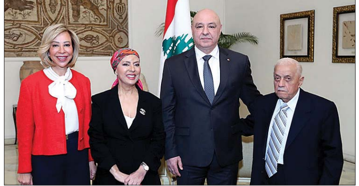
عون وعقيلته والمكرمة شديد والدها

الشرق - لحظات مليئة بال عاطفة والكلمات المؤثرة حفل بها قصر بعيدا امس الذي احتضن الكاتبة والإعلامية والمراسلة على مدى أكثر من ثلاثين عاما في القصر الرميّة هدى شديد، في حفل تكريم دعا اليه وحضره رئيس الجمهورية العماد جوزاف عون واللبنانية الاولى السيدة نعمت عون. وجاء تكريم شديد التي لم تعرف معنى الاستسلام ان في عملها، او في مواجهة تحديات الحياة مسطرة قصة كفاح تروى في صراعها مع المرض وتحدي الالم بايمان، اعترافا بتفانيها المهني وتمسكها بمواصلة العطاء والتضحية، حيث كان في كل خطوة اتخذتها امل لا يهزم وعزيمة لا تلين.