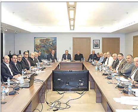
اجتماع اتحاد المستثمرين

الأعمال اللبنانيين المقيمين في لبنان وفي الخارج. وأكد أنه على اتحاد المستثمرين مسؤولية في تحديد متطلبات المرحلة الراهنة لجهة تحديد القوانين والخطوات المطلوب إقرارها بالتواصل والعمل مع الجهات المعنية، «لأن القطاع الخاص شريكاً أساسياً في عملية نهوض البلاد ومن دونه فإن هذه العملية شبه مستحيلة». وشدد على أن اتحاد المستثمرين اللبنانيين سيركز إجتماعاته مفتوحة للتواصل مع رجال الأعمال اللبنانيين في الداخل والخارج للتشاور معهم ووضع خارطة طريق أو على الأقل تحديد مرتكزات أساسية للاستثمار والوجهات الاستثمارية في لبنان. ثم تحدث شقير فأشاد باتحاد المستثمرين اللبنانيين وبالذور الذي يمكن أن يلعبه لتفعيل النشاط الاستثماري في لبنان في مختلف المجالات، خصوصاً أن الاتحاد يضم نخبة من المستثمرين اللبنانيين الذين لديهم نجاحات كبيرة في لبنان والخارج. وإذ اعتبر أن المرحلة واعدة وتؤسس لبناء لبنان الجديد، أكد وقوف الهيئات الاقتصادية الى جانب الاتحاد ودعمه للوصول الى الأهداف المرجوة.