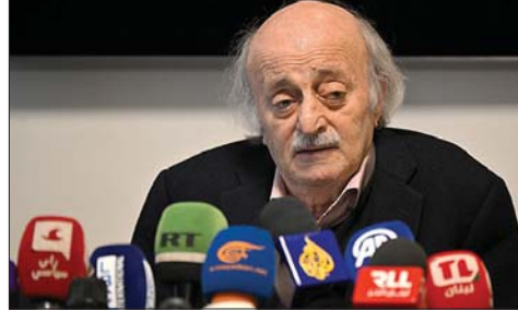
النائب السابق وليد جنبلاط

فلا اعتقد أن الذين وحدوا سوريا سيستجيبون لدعوة تنيهاه»: «تريد إسرائيل أن تستخدم الطوائف والمذاهب الصلح مع إسرائيل إلى أن تقوم لتفكيك المنطقة وهذا مشروع قديم ومشروعها التوراتي ليس له حدود من الضفة إلى بلاد كنعان وتريد تحقيق إسرائيل الكبرى وهذه مسؤولية القادة العرب قبل قوات الأوان». «شدد جنبلاط على أن «إسرائيل هي من تعرقل الـ 1701 وسبقي كما كنا مع القوى الوطنية ضد الصلح مع إسرائيل إلى أن تقوم دولة فلسطينية في يوم ما وبأني الحلّ للاجئين الفلسطينيين». «تريد الـ 16 من آذار 2025 ذكرى كبيرة شعبية ولن تكون هناك دعوات رسمية والعرب قبل قوات الأوان».