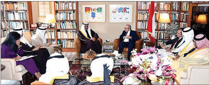
الوفد الكويتي والخليجي في زيارة سلام

الجانبين اللبناني والكويتي. ثم عقد مؤتمر صحافي فعدد البديوي لبعض النقاط عن الموقف الثابت والدائم لدول مجلس التعاون لوحدة واستقرار وأمن الجمهورية اللبنانية، وقال: