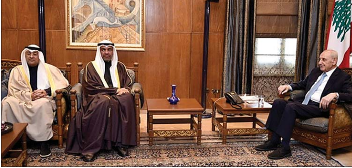
بري مستقبلاً البديوي والبيديوي