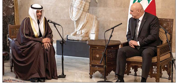
عون مستقبلاً وزير خارجية الكويت