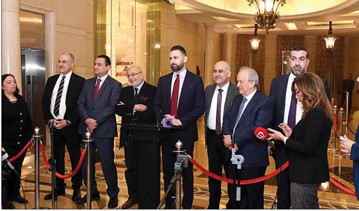
كتلة اللقاء الديمقراطي بعد اللقاء مع سلام