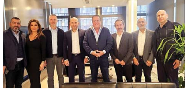
شقيير مع وفد الجمعية