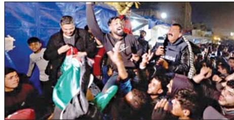
غزراويون يحتفلون لحظة إعلان التوصل لاتفاق وقف إطلاق النار

كان الوصول لانتخاب رئيس الجمهورية صعباً بعد عامين وأشهر من الفراغ. والأصعب منه انتخاب قائد الجيش لرئاسة الجمهورية. لذلك شاركت في الضغوط جهات دولية وعربية واللجنة الخماسية. أما رئيس الحكومة فقد كان وصوله عملاً داخلياً بحثاً قاده المعارضون والتغييريون في مجلس النواب، وانضمّ إليهم وليد جنبلاط وسمير جعجع وجبران باسيل والنواب السنة. فتخطوا مجتمعين الثنائي الشيعي ومرشحيه. التغيير صعب لكنه بدأ بقوة، والمأمول أن يتواصل مع سائر الجهات. لا يحبّ اللبنانيون التذكير كثيراً بحرب العام وثبت لعدم إثارة المزبد من الخصومات. لكن الواقع أنه في مجال رئاسة التتمة على الصفحة 14