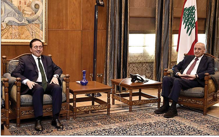
بري مستقبلاً الوزير الإسباني

الشرق - يجول وزير خارجية إسبانيا خوسيه مانويل الفاريس على المسؤولين اللبنانيين. واستقبل رئيس في بعبداء، عين التينة، نبيه بري في مقر الرئاسة الثانية في عين التينة، وزير خارجية إسبانيا خوسيه والوفد المرافق، إسبانيا خوسيه سانتوس أعودو بعد الظهر في القصر الجمهوري