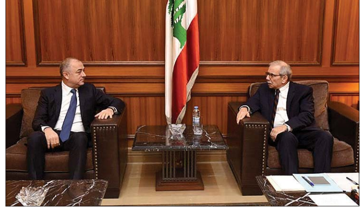
لقاء سلام وبو صعب

سلام: «أن تكون هذه الحكومة حكومة كفاءات وشكل الحكومة نتركه للرئيس عون والرئيس المكلف سلام». النواب الارمن: بدوره، دعا النائب أغوب بقرادونيان، بعد لقاء كتلة نواب الارمن، الرئيس المكلف القاضي نواف سلام، إلى «تشكيل حكومة جامعة مع ضرورة مراعاة الدستور واتفق الطائف في التمثيل ولدينا كل الاستعداد للمشاركة في الحكومة».