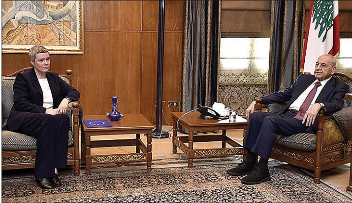
لقاء بري وودو وال

الشرق - قال رئيس مجلس النواب نبيه بري لفتاة ال LBCI انه «لم يحصل إتصال بيني وبين الرئيس الفرنسي إيمانويل ماكرون الذي كان مقرراً». ورداً على سؤال حول ما إذا كانت مقاطعة جلسة الإستشارات هي رسائل للخارج قال: «لبنان بدو يمشي». واعلن ان «سأستقبل الرئيس نواف سلام الجمعة»... ورداً على سؤال حول ما إذا سيكون هناك لقاء يجمع الرئيس سلام بكتلتي أمل وحزب الله، اجاب: «هيدي فيها إن».