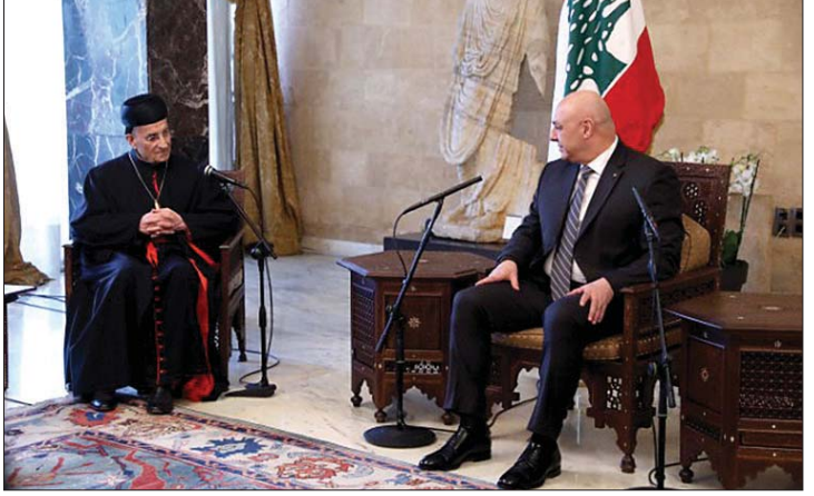
عون مستقبلاً الراعي