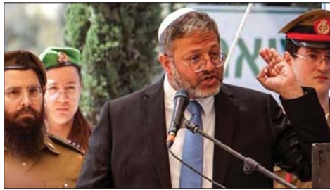
بن غفير الى خارج الحكومة بسبب معارضة الصفقة

في إسرائيل أبدت تأييدها للصفقة، حيث أشار زعيم حزب "شاس" أرييه درعي، إلى أن تحرير الأسرى يمثل أولوية دينية وإنسانية، مؤكداً أن حزبه سيقف خلف رئيس الوزراء لتحقيق ما وصفه بـ"واجب إنقاذ الأرواح".