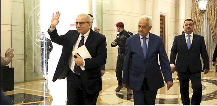
وصول الرئيس المكلف الى مجلس النواب