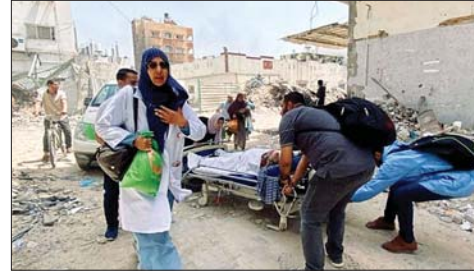
نقل جريح فلسطيني في غزة

ذكرت وسائل إعلام إسرائيلية، الجمعة، أن قوة إسرائيلية خاصة دخلت قطاع غزة لكن مقاتلين فلسطينيين كشفوها في رفح جنوب القطاع. وأضافت أن المقاومة الفلسطينية أوقعت في صفوف القوة الإسرائيلية قتلى ومصابين، وأشارت إلى أن القوة الإسرائيلية المتتكرة كانت قد دخلت عبر معبر كرم أبو سالم. وقالت وسائل إعلام إسرائيلية إن المزيد من التفاصيل ستنتشر بعد انتهاء عيد الغفران اليوم. وتم تعلن فصائل المقاومة الفلسطينية حتى الآن عن الحدث، غير أنها أكدت خلال الأيام الماضية التصدي لآليات وجنود الاحتلال في مختلف مناطق قطاع غزة، لا سيما في الشمال. وأفاد جيش الاحتلال الإسرائيلي بأن سلاح الجو اعترض صباح الجمعة طائرة مسيرة اخترقت الأجواء الإسرائيلية بعد دوي صفارات الإنذار في محيط عسقلان جنوبي إسرائيل. وأعلنت كتائب عز الدين القسام الجناح العسكري لحركة المقاومة الإسلامية (حماس) تدمير ناقلة جند إسرائيلية وإيقاع طاقمها بين قبيل وجريح غرب مدينة بيت لاهيا شمالي قطاع غزة. وكان الجيش الإسرائيلي قد أعلن مقتل 3 ضباط برتبة رائد في معارك