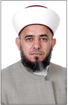
الشيخ وفائق حجازي

الشرق - ندد مفتي راشيا الشيخ الدكتور وفائق حجازي، في بيان به الجرائم الصهيونية بحق لبنان، والتي طالت الوطن بأسره، وأثخنت فيه الجراح والدمار والضحايا، وشتت شمل اللبنانيين حتى هجرتهم خارج لبنان». وشدد حجازي على «الوحدة الوطنية اللبنانية والإيمان بالدولة الحرة المستقلة ذات السيادة في جميع قراراتها وسلمها وحررها، وأن يكون السلاح فقط بيد الدولة من خلال أجهزتها الرسمية فقط، وعدم الرهان على الخارج، لأنه تبين أنه يعمل لمصلحه على حساب الوطن وسيادته». واعتبر «أن ما يجري في حق الوطن ألا يتطلب التوافق لانتخاب رئيس للجمهورية يعيد البوصلة في العمل الدستوري اللبناني أمام انتهاك سيادة لبنان»، مذكراً بـ «مرور عام من الدمار بحق غزة وأهلها وهذه جريمة العصر بحق شعب حمى الله لبنان وفلسطين من كيد الكائدين».