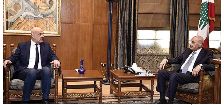
بري مستقبلاً مولوي

الشرق - أشار رئيس مجلس النواب نبيه بري حول تصاعد خطاب الداخل باتجاه تطبيق القرار 1559، الى ان القرار الوحيد هو 1701، أما القرار 1559 فصار وانا وينذكر ما ينعاد». ولفت بري في حديث الى قناة «الجديد» الى اننا نعمل ليلاً نهاراً مع رئيس حكومة تصريف الاعمال نجيب ميقاتي للتوصل إلى وقف إطلاق النار، و«هلق الموج عالي وبعدين بينزل والمصيبة بتخلق كبيرة وبترجع تصغر». وادرد «الاميركيون يتواصلون معنا ويقولون أنهم مع الحل إلا أن «الكلام كثير والفعل قليل». وحول تصعيد عمليات المقاومة ضد اسرائيل، اعتبر رئيس المجلس بان المعارك تؤثر بشكل مباشر لدفع المجتمع الدولي نحو الحل. وتعليقاً على دعوة رئيس حزب القوات سمير ججعج إلى حوار وطني في معراب، قال: «ما قبل نعمل معراب بالمجلس». من جهة ثانية استقبل بري في مقر الرئاسة الثانية في عين التينة، السفير البايوي في لبنان المونستور باولو بورجيا، وتم عرض للأوضاع