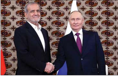
لقاء بوتين وبزشكيان

أنواع الاتفاقيات الدولية. وأضاف "إنها تفعل ذلك لأنها تعلم أن الولايات المتحدة والاتحاد الأوروبي يقفان وراءها". وجاءت تلك التصريحات في ظل حالة الترقب التي تخيم على المنطقة تحسباً لمزيد من التصعيد، مع ترقب هجوم إسرائيلي على إيران عقب ضربة صاروخية شنتها إيران في الأول من تشرين الأول الحالي.