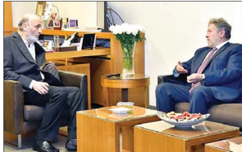
لقاء افرام وججعج

النازحين اللبنانيين وهم اخوتنا الذين سبقو معهم «على الحلوة والحلوة». وعن مشاركته في مؤتمر «معراب ٢»، «أجاب: «مبدئياً نعم، وهذا ما تحدثنا عنه اليوم مع الدكتور ججعج، فهذا المؤتمر يضم نواباً من المعارضة والمستقلين. ونظراً للمساحات المشتركة وللعلاقة التي تجمعنا مع «القوات»، سيشارك مشروع وطن الانسان» إما بشخصي او من خلال ممثلين عنه، وهذا وفق مشاركة النواب المستقلين، ولكن في المبدأ انه لقاء جامع لكل من يعتبر ان تطبيق القرار الدولي 1701 من مسؤوليتنا كلبانين، ولمن يرى ان لبنان لا يبريد الحرب وانه بلد سيد حر مستقل، تُتخذ قراراته لمصلحة ابنائه فحسب».