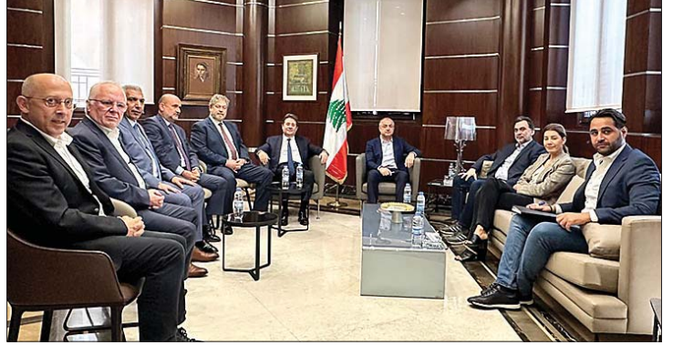
اللقاء النيابي في المجلس