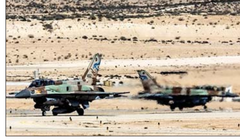
مقاتلتان إسرائيليتان بانتظار الأوامر

ديمر، قبل مكالمته بايدن ومنتياهو. وكانت مكالمته سوليفان -ديمر هي المناقشة الأكثر تفصيلاً حتى الآن بين الولايات المتحدة وإسرائيل فيما يتعلق بخطة تل أبيب. وقال مسؤولون أميركيون وإسرائيليون كبار إن بايدن ومنتياهو، أكدا على إطلاق إيران حوالي 180 صاروخاً على إسرائيل، في هجوم تم إحباطه إلى حد كبير. وقال مسؤولون أميركيون إن مكالمته منفصلة جرت الأربعاء بين مستشار الأمن القومي جيك سوليفان ووزير الشؤون الاستراتيجية الإسرائيلي رون بايدن، بحسب مسؤولين إسرائيليين.