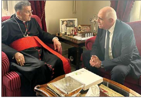
الراعي مستقبلاً قصيفي

وفق القواعد الدستورية، على أن يكون قادراً مع الحكومة الجديدة التي ستتشكل على التصدي لتداعيات الحرب على جميع الصعد. وشدد على الوحدة الوطنية بين اللبنانيين وفتحين اواصر التآخي والمحبة في ما بينهم لأن لبنان هو وطنهم جميعاً، وعليهم مسؤولية كبرى في إعادة اللحمة اليه واستعادته إلى كنف الشرعية التي ينبغي أن تكون وحدها الملاذ والمرجع. واستقبل الراعي الوزير السابق مروان شربل، وعرض معه للتطورات الراهنة.