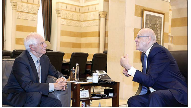
اجتماع ميقاتي وبوريل

أعربت عنها، زاد التصعيد، والمخاوف من امتداد الحرب في غزة والمخاوف من معان إنسانية أكثر انتشاراً» وحث بوريل جميع القادة في لبنان على العمل من أجل مصلحة بلادهم وتجنب المصالح الأخرى. كما شدد على وجوب عودة الاستقرار في لبنان عبر إنهاء الفراغ الرئاسي وأن تعود المؤسسات اللبنانية إلى العمل بما في ذلك رئاسة الجمهورية ورئاسة الحكومة. وأضاف بوريل: «الحرب في غزة تهدد الأمن والاستقرار في المنطقة وخاصة في لبنان وندين القتل الوحشي للمدنيين في غزة». وكان قائد الجيش العماد جوزف عون استقبل في مكتبه في البرزة، بوريل، بحضور سفيرة الاتحاد الأوروبي في لبنان ساندرا دو وال، وجرى التداول في أوضاع لبنان والمنطقة والتطورات عند الحدود الجنوبية.