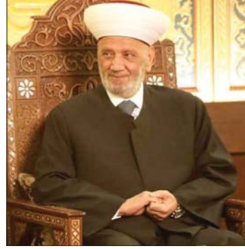
المفتي عبد اللطيف دريان

أياها المسلمون، أيها اللبنانيون في مناسبة المولد النبوي الشريف علينا ان نكتفي بالإدانة والتعريض. فالتمهون معروفون، وكذلك وثائق الاتهام. ومن خلال هذا الواقع ينبغي بدون تأخر ولا تردد الانصراف لانتخاب رئيس بالطريق الدستوري المعروف. فالبلد في خطر داهم، ويعيش قمة الانقسام والتشرذم والفوضى، لم يعد يحتمل لبنان المزيد من الخراب والانهايار والدمار، والتأخير في انتخاب رئيس للجمهورية، هو تدمير ممنهج للبنان الدولة والمؤسسات. وجه دريان رسالة إلى اللبنانيين، بمناسبة المولد النبوي الشريف، ومما جاء فيها: يتجدد فرحنا كل عام، وهو فرح مسؤول، فقد قال الله في سورة الصبح: {فأما اليتيم فلا تقهر، وأما السائل فلا تنهر، وأما بنعمة ربك فحدث}. وهكذا تظهر المسؤولية اليوم في كل حذب وصوب. هناك الحرب على غزة، والحرب على الجنوب ولبنان. وهناك الغيطان الذي لا يتوقف على الشعب الفلسطيني وأطفاله ونسائه وشيوخه، وأرضه وأقصاه ومساجده ومعابده. ما عانى شعب في العالم ما عاناه الشعب الفلسطيني ويعانيه، فإلى متى يا رب العالمين، يا رحمن يا رحيم، وأنت القائل: {ولله العزة ولرسوله وللمؤمنين ولكن المنافقين لا يعلمون}. وقد استغاثت صلوات الله وسلامه عليه بربه ومولاه، عندما أخرج أهل الطائف من مدينتهم، فقال ملتاعا: (إلى من تكلني، إلى سفيه يتجهمني أم إلى عدو ملكته أمري؟) وما ودعه عز وجل ولا قلاه ولا تجهمه، بل اصطفاه وأكرمه وقال له: {ورفعنا لك ذكرك}. وكذلك سيحدث للشعب الفلسطيني المهجر والمُعذب على أرضه ووسط دياره، وبالصبر والعزيمة والشهادة، وحب الحرية.