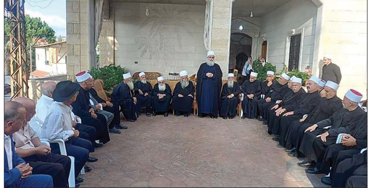
من جولة أبي المنى

الشرق - استقبل شيخ العقل لطائفة الموحدين الدروز الشيخ الدكتور سامي أبي المنى في دار الطائفة في بيروت، رئيس الرابطة السريانية أمين عام «اللقاء المشريقي» حبيب افرام، وتناول اللقاء قضايا وطنية وروحية عامة، وما يتعلق منها بالمؤتمر المنوي عقده قريبا في بيروت، حول التنوع الديني. وترأس اجتماعاً لهيئة الدينية الاستشارية لمشيخة العقل، حيث تم خلال اللقاء وضع المجتمعين في أجواء انتخابات المجلس المذهبي التي حصلت وتقييم المرحلة السابقة، والتأكيد على استمرار العمل