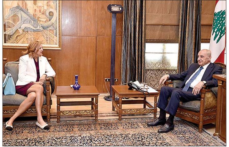
لقاء بري وجونسون

الشرق - استقبل رئيس مجلس النواب نبيه بري في عين التينة، السفارة الأميركية لدى لبنان ليزا جونسون، وتناول البحث المستجدات السياسية والعلاقات الثنائية بين البلدين.