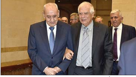
بري مستقبلاً بوريل

نواب قوى المعارضة بعريضة لتشكيل لجنة برلمانية للتحقيق «في الجرائم والشبهات والتجاوزات وأفعال التصدير والاهمال في ملف الكهرباء».