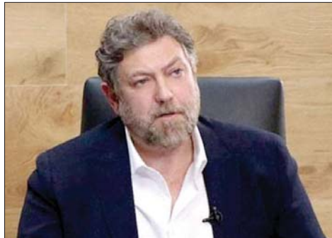
النائب نعمة إفرام

الشرق - عقد المجلس التنفيذي لـ «مشروع وطن الإنسان» اجتماعه الأسبوعي برئاسة النائب نعمة إفرام وحضور الأعضاء. وبعد التداول بالتطورات الأخيرة داخلياً وخارجياً، صدر التالي: