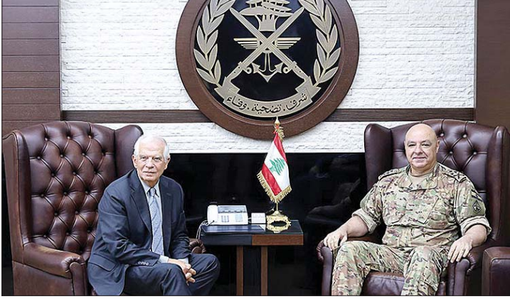
بوريل في زيارة قائد الجيش