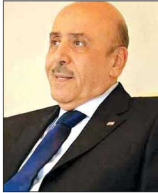
مدير مكتب الامن القومي السابق اللواء علي مملوك

إثر ذلك، غابت أي مؤشرات إلى أنهما على قيد الحياة، إلى أن تمّ الإعلان عن وفاتهما في آب 2018.