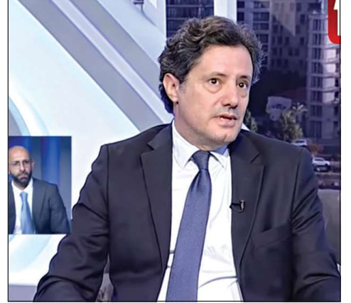
الوزير زياد مكاري