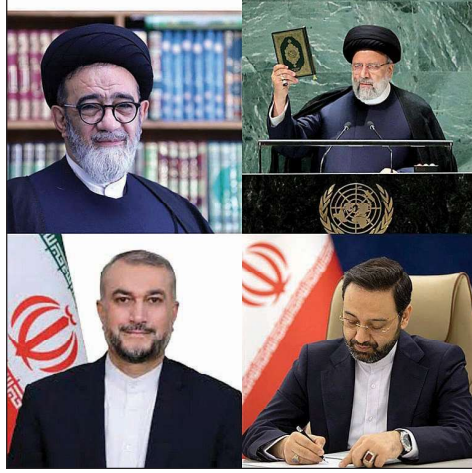
رئيسي وآية الله هاشم ومحمافظ تبريز وعبداللهيان على متن المروحية

الشرقية ووزير الخارجية حسين أمير عبداللهيان كانا على متن المروحية التي تقل الرئيس الإيراني. وبدأت فرق الإنقاذ التابعة للهلال الأحمر والقوات العسكرية وقوات الشرطة المساعدة في عملية واسعة النطاق للعثور على هذه المروحية. ويقول السكان المحليون إن حالة المروحية لا تزال مجهولة بسبب الأجواء الضبابية في المنطقة. واضطرت هذه المروحية إلى الهبوط بسبب سوء الأحوال الجوية شمال أذربيجان الشرقية، وانتقل موكب رئيس الجمهورية إلى تبريز مركز المحافظة عبر الطريق البري. من جهتها، نقلت وكالة رويترز عن مسؤول إيراني أن "حياة" الرئيس رئيسي ووزير الخارجية في خطر عقب حادث طائرة هليكوبتر". أضاف المسؤول الإيراني: "لا نزال يحصدنا الأمل لكن المعلومات الواردة من موقع التحطم مقلقة للغاية". ولا توجد معلومات عن كيفية نزول الطائرة بشكل واضح حتى الآن لكن الحديث يدور عن نزول صعب، علماً بأن منطقة "جلفا" التي نزلت فيها الطائرة تشهد طقساً صعباً جداً يصعب معه تحديد ماذا حدث بالضبط. وأفيد أن هناك معلومات عن اتصال تم مع أحد مرافقي الرئيس، وهذا ما جعل الجميع في إيران يتحدث بأمل عن أن من كانوا على متن الطائرة في حال جيدة. وكان الجنرال محمد باقري قد أعلن ان الجيش والحرس الثوري يشاركان مع هيئات الإنقاذ المتخصصة في عمليات البحث عن الطائرة الرأسيّة.