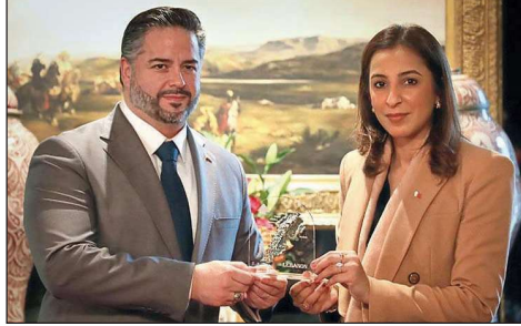
سلام ونور بنت علي

عقد وزير الاقتصاد والتجارة في حكومة تصريف الاعمال الدكتور أمين سلام اجتماعاً مع وزيرة التنمية المستدامة في البحرين السيدة نور بنت علي الخليفة، في حضور الوفد اللبناني المرافق المشارك في الاجتماع التحضيري على المستوى الوزاري لمجلس جامعة الدول العربية على مستوى القمة العربية، الدورة العادية 33. وأكد الطرفان، وفق بيان مكتوب سلام، "عمق العلاقات التي تربط مملكة البحرين ولبنان وأهمية الدفع بمسارات التعاون القائم بين الدولتين الشقيقتين نحو مستويات أكثر تقدماً". وقد أشارت الوزيرة نور بنت علي الخليفة، "أن جلالة الملك حمد بن عيسى آل خليفة يولي أهمية كبرى للتعاون العربي وفتح مسارات جديدة ومد جسور التعاون مع الجميع في ما له الخير لامتنا". كما أكدت الخليفة في خلال الاجتماع "أن المملكة تحرص على الاستمرار في تكتيف جهودها واتخاذ خطوات متقدمة لتسريع وتيرة تنفيذ أهداف التنمية المستدامة". وأشار البيان إلى "أن الوزير سلام يولي هذا اللقاء اهتماماً اولاً: من منطلق جعل لبنان وجهة استثمارية آمنة ومرجحة للمستثمرين البحرينيين والعرب، وثانياً: توجه وزارة الاقتصاد والتجارة اللبنانية للتعاون مع وزارة التنمية المستدامة البحرينية لدورها البارز في تبني مجموعة من المبادرات والبرامج الطموحة التي تدعم توفير المزيد من الفرص النوعية للبحرنيين وإمكانية الاستفادة من خبراتهم لبنانية اتخذت قرار التحول الرقمي وتطوير نشاطها". بدوره، أثنى الوزير سلام على جهود مملكة البحرين الحثيثة في تحقيق أهداف التنمية المستدامة خلال اللقاء، أبرز التحديات والمتغيرات العالمية والعربية وتم استعراض الحلول والتطورات المتعلقة بمختلف القطاعات