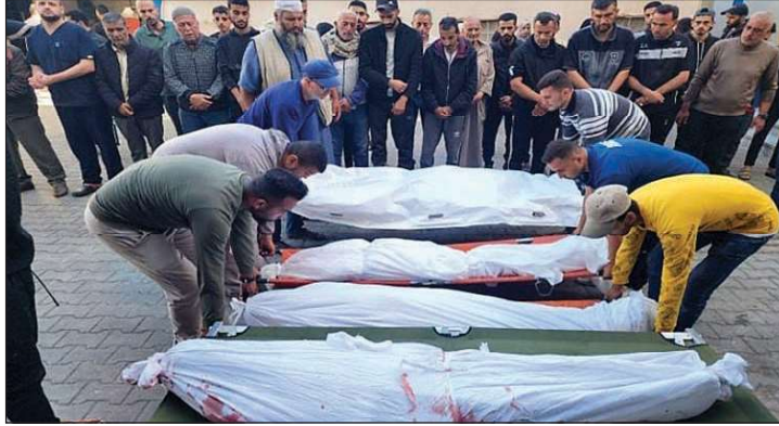
جثامين شهداء سقطوا بغارات الاحتلال أمس

وأعلنت كتابت القسام الجناح العسكري لحركة "حماس"، السبت، قتل 5 جنود إسرائيليين وإصابة آخرين إثر استدرج قوة راجلة واستهدافها بعبوة مضادة للأفراد شرق مدينة رفح جنوبي قطاع غزة. من جهته، أعلن جيش الاحتلال عن مقتل اثنين من جنوده، في عملية تفجير فتحة نفق في مدينة رفح، أدت العملية أيضا لإصابة ضابط و3 جنود بجراح خطيرة. كما كشفت عن إصابة 44 جنديا بينهم 8 في حال الخطر.