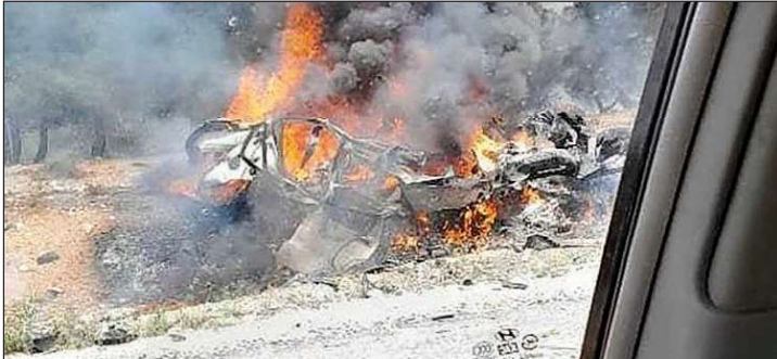
السيارة المستهدفة في منطقة المصنع